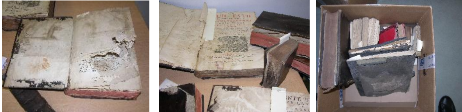
Tri et quarantaine des ouvrages perdus, bloc papier, dentelles, tâches.