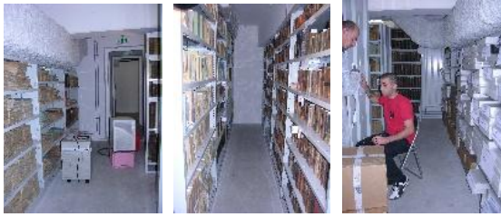
Rangements des cartons, des volumes et des périodiques.