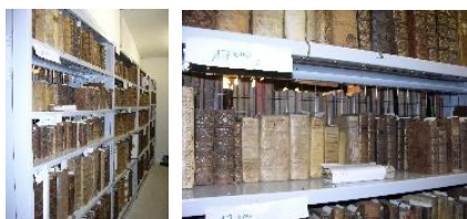
Les travées des 17 e et 18 e mieux ciblées.