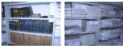
Rangement des périodiques, les liasses sont en boîtes de conditionnement.