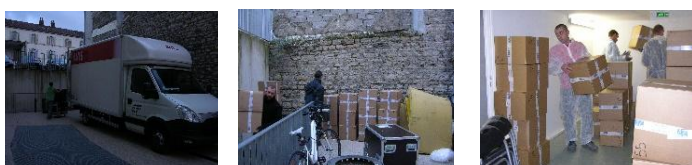
Arrivée du camion de A2C et des cartons documents assainis, rangement serré des cartons.