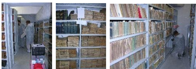
Poursuite, les volumes sont préclassés.