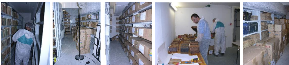
1eres installations des documents, des cartons, des repérages de documents.