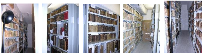
Rangement par format, époque et série.