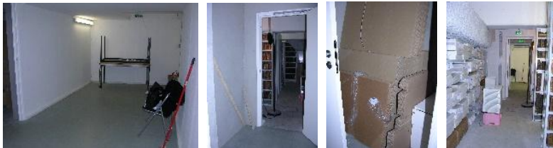
Locaux, couloirs propres, libres, accès, dépôt des cartons propres, déshumidificateur en activité.